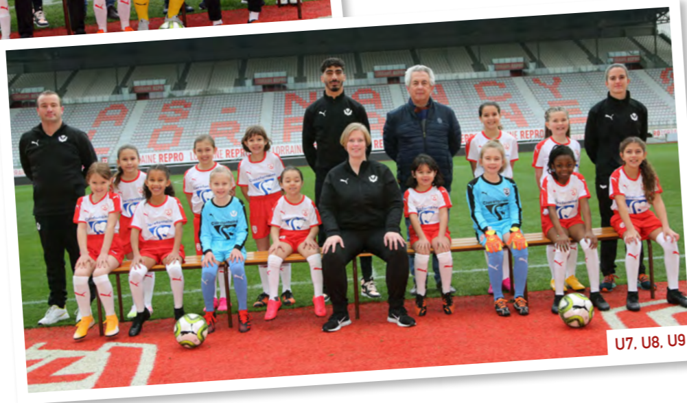
U7, U8, U9